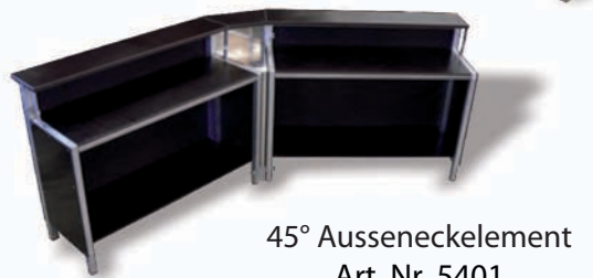
45° Ausseneckelement Art. Nr. 5401