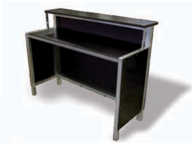
Barelement 1.5m Art. Nr. 5398