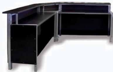
90° Ausseneckelement Art. Nr. 5399