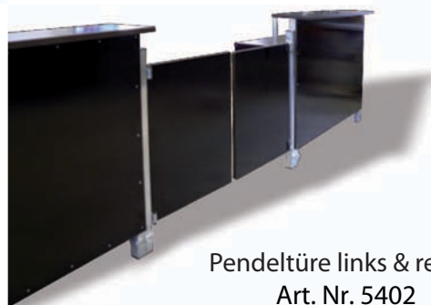
Pendeltüre links & rechts Art. Nr. 5402